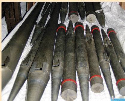
Opslag in de kelder van het voormalige politiebureau.

Vrijwilligers van de stichting zijn druk in de weer geweest om alle orgelpijpen vakkundig op te slaan. Orgelpijpen zijn heel kwetsbaar en het was belangrijk om het doorzakken van de orgelpijpen te voorkomen. De vrijwilligers van de stichting hadden stellages gebouwd waarop de orgelpijpen netjes ingepakt naast elkaar lagen.