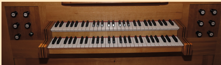
Het speelklavier van het continuo-orgel.

Het orgel heeft twee klavieren. Het onderklavier is voor de begeleiding en het bovenklavier voor de soloregistraties. Het pedaal is permanent gekoppeld aan het onderklavier. Ook is er een klavierkoppel. De muziklessenaar is helemaal dicht aan de achterzijde, zodat de bladmuziek er niet doorheen kan vallen. De muziklessenaar en het pedaal zijn voorzien van ledverlichting.