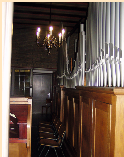
De opstelling van het orgel onder het glas-in-lood raam.