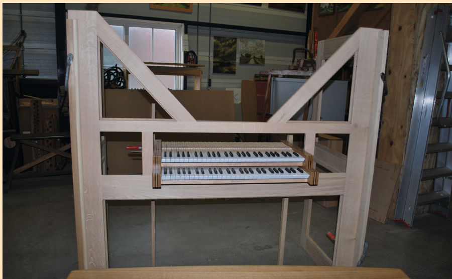
De beginfase van de bouw.

Het bijzondere aan dit orgel is dat dit geschikt is voor samenspel met koren, solisten en ensembles. Hierdoor kan het orgel breed ingezet worden voor de erediensten, concerten en muzikale studies.