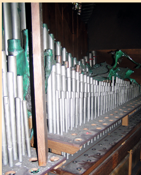
De versmolten plastic is zichtbaar op de orgelpijpen.

In het voorjaar van 2011 hebben vrijwilligers het gehele pijpwerk van het orgel gedemonteerd, getransporteerd en veilig opgeslagen. Tijdens deze demontage werd het duidelijk dat verschillende registers nog in perfecte staat verkeerden.