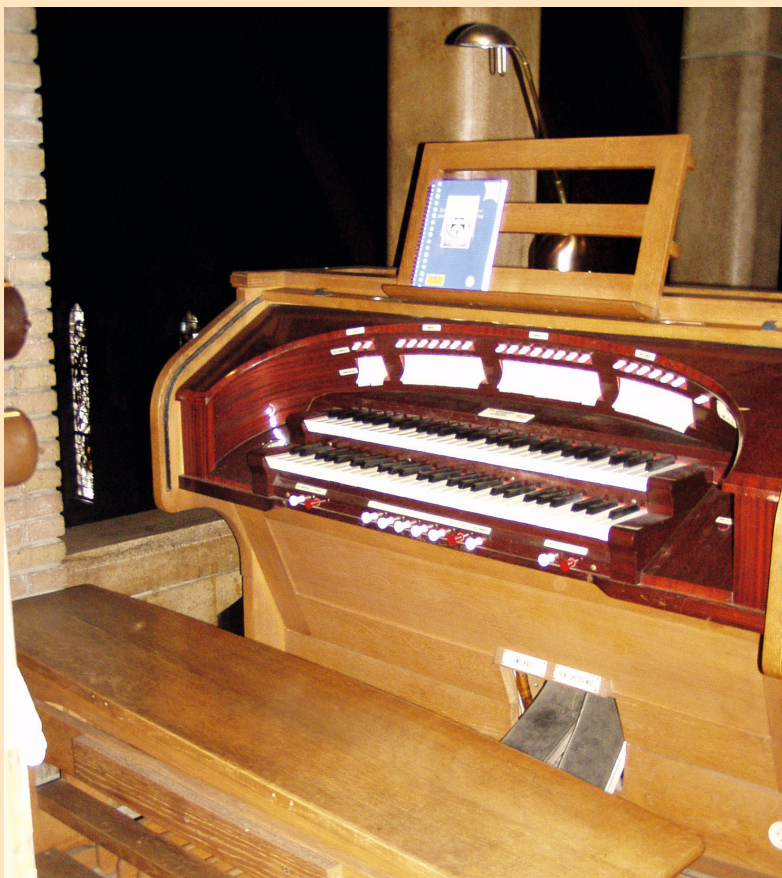
De speeltafel van het voormalige Verschueren orgel uit de ziekenhuiskapel (foto anno 2008). Het is zichtbaar dat de registers allemaal schakelaartjes zijn.

Een mechanisch orgel heeft trekregisters (knoppen).