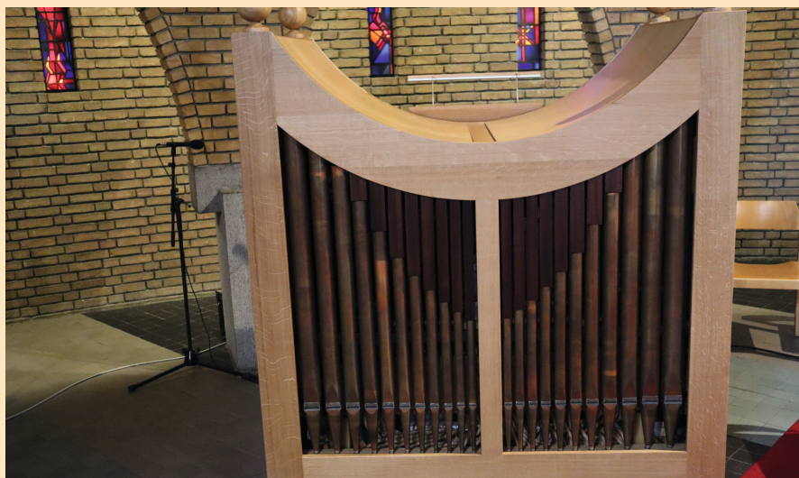
Het front van het continuo-orgel.

Het orgel heeft twee klavieren. Het onderklavier is voor de begeleiding en het bovenklavier voor de soloregistraties. Het pedaal is permanent gekoppeld aan het onderklavier. Ook is er een klavierkoppel. De muziklessenaar is helemaal dicht aan de achterzijde, zodat de bladmuziek er niet doorheen kan vallen. De muziklessenaar en het pedaal zijn voorzien van ledverlichting.