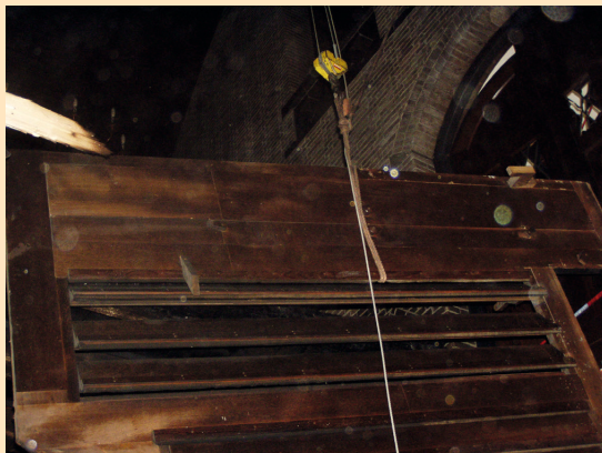
Demonteren en naar beneden takelen van de zware orgelonderdelen.

In het najaar 2011 werden de zware orgelonderdelen (mechanieken) gedemonteerd en opgeslagen. De stichting is dankbaar dat de gemeente Sittard-Geleen een ruimte ter beschikking heeft gesteld voor de opslag van de orgelonderdelen in de kelderruimtes van het voormalige politiebureau aan de President Kennedysingel in Sittard.