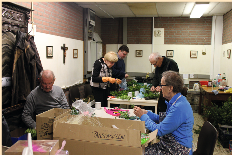
Vrijwilligers zijn druk in de weer om de paasstukjes te maken.

Ook veel dank aan iedereen die een bijdrage heeft geleverd aan het tot stand brengen en promoten van het boek en de film getiteld “Adieu aux Sœurs” , waarin op een inspirerende manier de herinneringen aan een eeuw Franse zusters in Sittard zijn weergegeven.