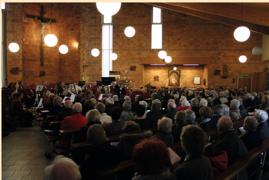
Benefietconcert / kerstconcert 11 december 2016 in de St. Pauluskerk Limbrichterveld.

Naast de benefietconcerten hebben er ook andere sponsoractiviteiten plaatsgevonden. In het bijzonder willen wij graag de “paasstukjesacties” benoemen die vele jaren in Sittard rondom Pasen heeft plaatsgevonden. Op een gegeven moment werd de “paasstukjesactie” zo bekend, dat wij al in januari van het jaar bestellingen ontvingen voor één of meerdere paasstukjes. Dank aan onze vrijwilligers die jaren lang vele uren bezig zijn geweest met het maken van de paasstukjes.