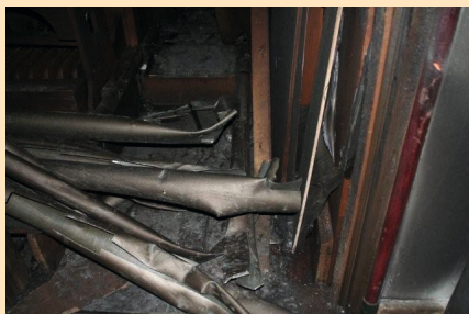
Brandschade in 2010.

In het voorjaar van 2011 hebben vrijwilligers het gehele pijpwerk van het orgel gedemonteerd, getransporteerd en veilig opgeslagen. Tijdens deze demontage werd het duidelijk dat verschillende registers nog in perfecte staat verkeerden.