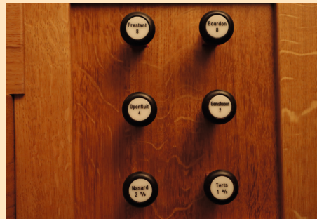
Het speelklavier en trekregisters van het nieuwe continuo-orgel (anno 2022).

Voor de organist, en met name in de barokmuziek, heeft dit een bijzondere meerwaarde omdat de touché ( aanslag ) meer voelbaar is in het musiceren.