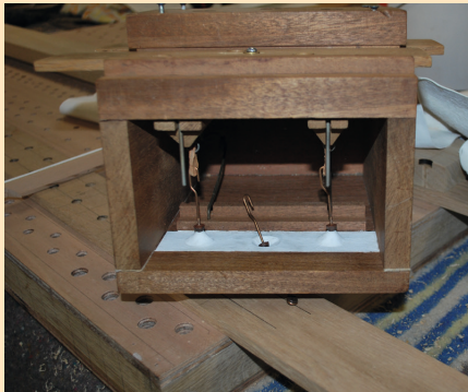
De bouw van de mechanieken.