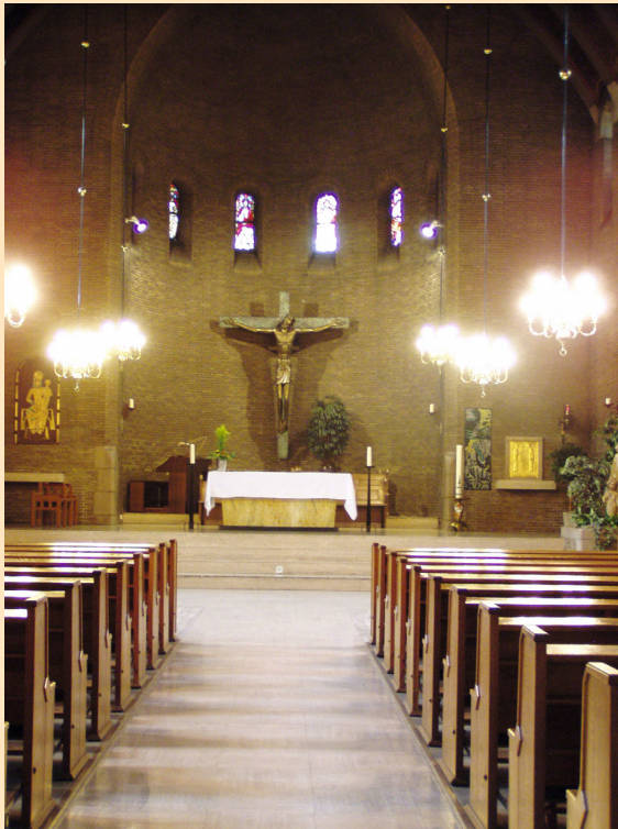
Voormalige ziekenhuiskapel waar het orgel oorspronkelijk heeft gestaan (foto anno 2008).

Onze stichting is in het bezit van de archiefstukken zoals beschrijvingen, bouwtekeningen en correspondentiebrieven betreffende de bouw van dit orgel in de jaren 1938 / 1939. Als bij het lezen van dit hoofdstuk uw interesse is gewekt om nog meer specifieke achtergrondinformatie te willen weten, dan kunt u via het secretariaat van onze stichting de archiefstukken opvragen.