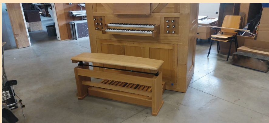
Het orgel opgebouwd in de orgelwerkplaats.

Het orgel is vervaardigd van licht massief gelakt eikenhout. Een belangrijke verandering in de nieuwbouw is, dat de tractuur is veranderd van elektro-pneumatisch naar mechanisch. Eenvoudig gezegd betekent het een verandering van elektrische verbindingen tussen de klavieren en orgelpijpen naar mechanische verbindingen door bijv. touwtjes en latjes. Een elektro-pneumatisch orgel heeft vele schakelaartjes op de speeltafel.