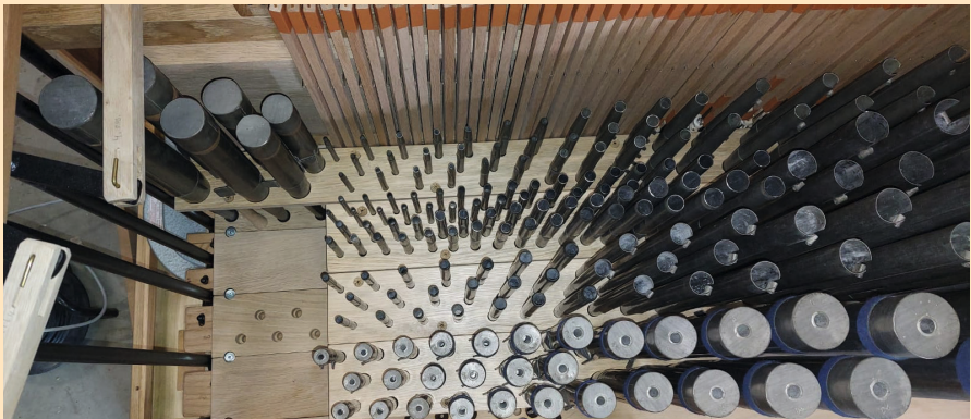
De orgelpijpen zijn gerestaureerd en geplaatst.